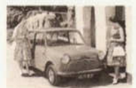
Damals noch ein Austin Seven.