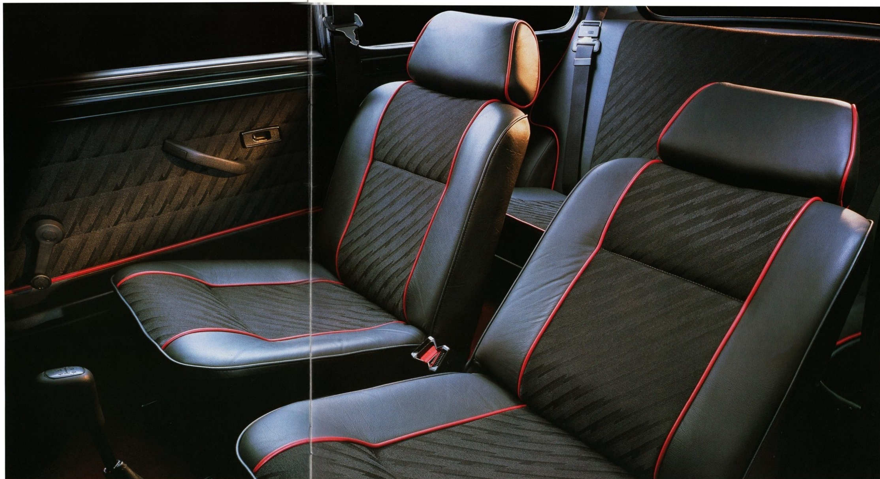
Cinturones traseros opcionales