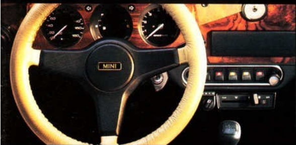
Schön sportlich: Drehzahlmesser an Bord.