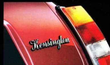
New kid on the block: der MINI Kensington

Tja, Autos gibt's viele. Aber es gibt eben nur einen MINI. Und hier ist der schönste: der MINI Kensington. The one and only - only for you.